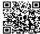
とらっこ2次元バーコード